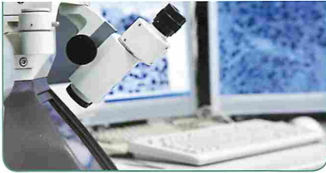
⌄ Zeitgemäße Labordiagnostik: Modernste Medizin