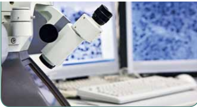
⤴ Zeitgemäße Labordiagnostik: Modernste Medizin